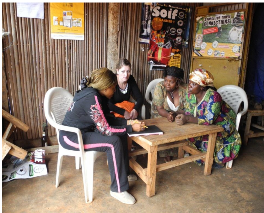
Mission rédaction de projet au Cameroun

Cela nous semble la meilleure méthode pour que vous partiez en toute sécurité et que vous soyez efficace après un petit temps d'installation dès que vous serez sur place.