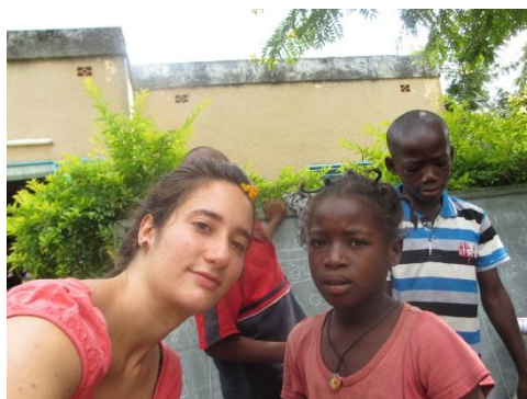
Soutiens scolaire au Burkina été 2012

Que les premières courageuses volontaires qui ont commencé ces « chaînes » en soient ici remerciées.